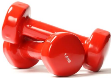
SPORT (Sport- und Fitnessgeräte)

Hohe chemische Beständigkeit für eine außergewöhnliche Fleckenbeständigkeit gegenüber Lebensmittelsubstanzen wie Kaffee, Milch, Wein, Tomaten sowie den gängigsten Haushaltsreinigungsmitteln.