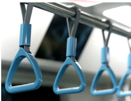
ALLGEMEINE INDUSTRIE (Industriemaschinen, Automatisierung, Komponenten)

Farbe bringt Freude in Gemeinschaftsbereiche, grenzt Räume ab und macht sie einzigartig. Isofan bringt nicht nur Farbe, sondern auch ausreichenden Schutz gegen die Auswirkungen von Licht und der Witterung. Beständigkeit in Farbe, ist eine gelungene Synergie!