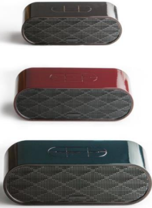
HAUSHALTSGERÄTE (Kühlschränke, Kaffeemaschinen, Haushaltskleingeräte, Hightech)

Hohe chemische Beständigkeit für eine außergewöhnliche Fleckenbeständigkeit gegenüber Lebensmittelsubstanzen wie Kaffee, Milch, Wein, Tomaten sowie den gängigsten Haushaltsreinigungsmitteln.