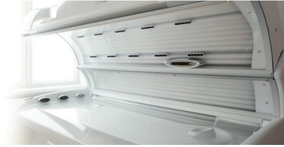
HEALTH & BEAUTY CARE (Medizin und Beauty Geräte)

Von nun an wird Isofan Schönheitszentren und medizinischen Einrichtungen die richtige Farbe geben, damit sich ihre Patienten geborgen fühlen.