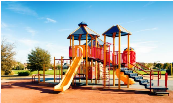
HABITAT OUTDOOR (Garten- und Stadtmöbel, Spielplätze)

Von nun an wird Isofan Schönheitszentren und medizinischen Einrichtungen die richtige Farbe geben, damit sich ihre Patienten geborgen fühlen.