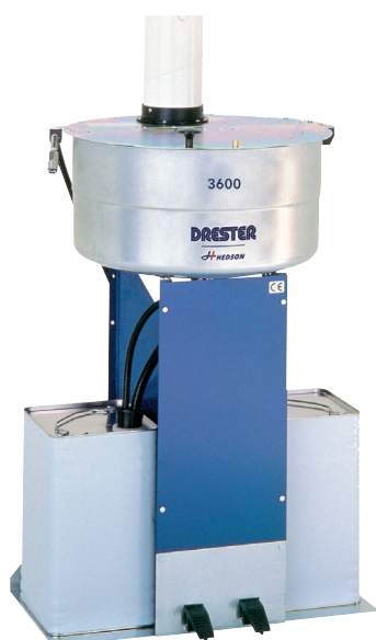
Abbildung zeigt blaue Variante, nicht INOX