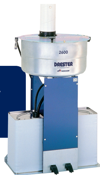
Abbildung zeigt blaue Variante, nicht INOX